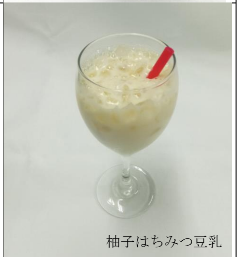
柚子はちみつ豆乳