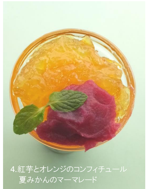
4. 紅芋とオレンジのコンフィチュール 夏みかんのマーマレード