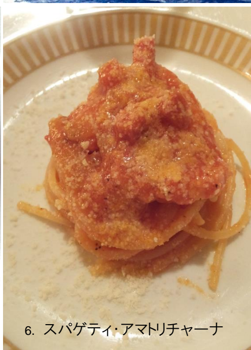
6. スパゲティ・アマトリチャーナ