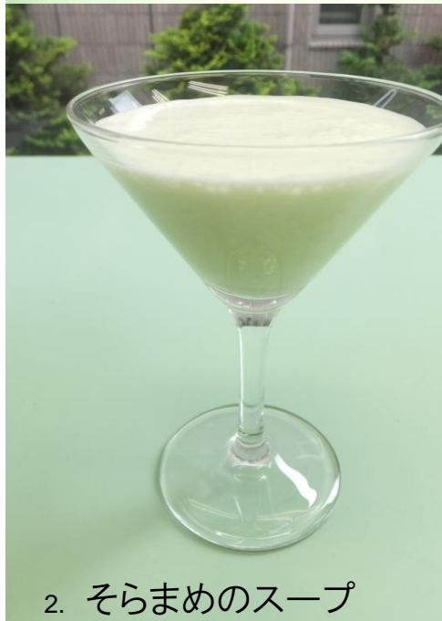
2. そらまめのスープ