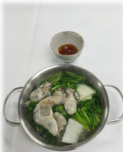
牡蠣と春菊のしゃぶしゃぶ ・ニンニクたれで