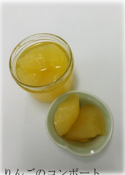
りんごのコンポート