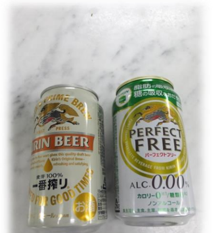
キリン「一番搾り」&「パーフェクトフリー」「アルカリイオンの水」