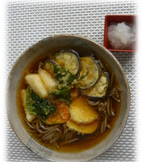
飲み込みやすい チーズと野菜の天ぷらそば