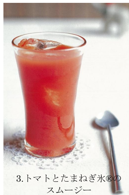
3. トマトとたまねぎ氷®の スムージー