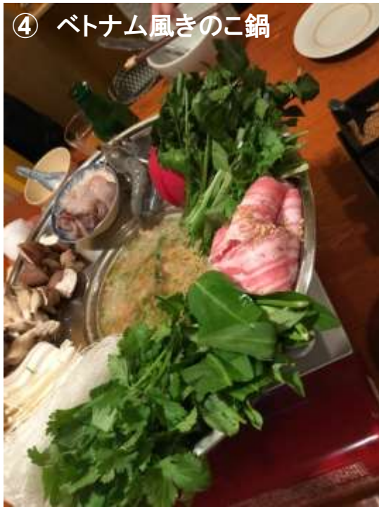
④ ベトナム風きのこ鍋